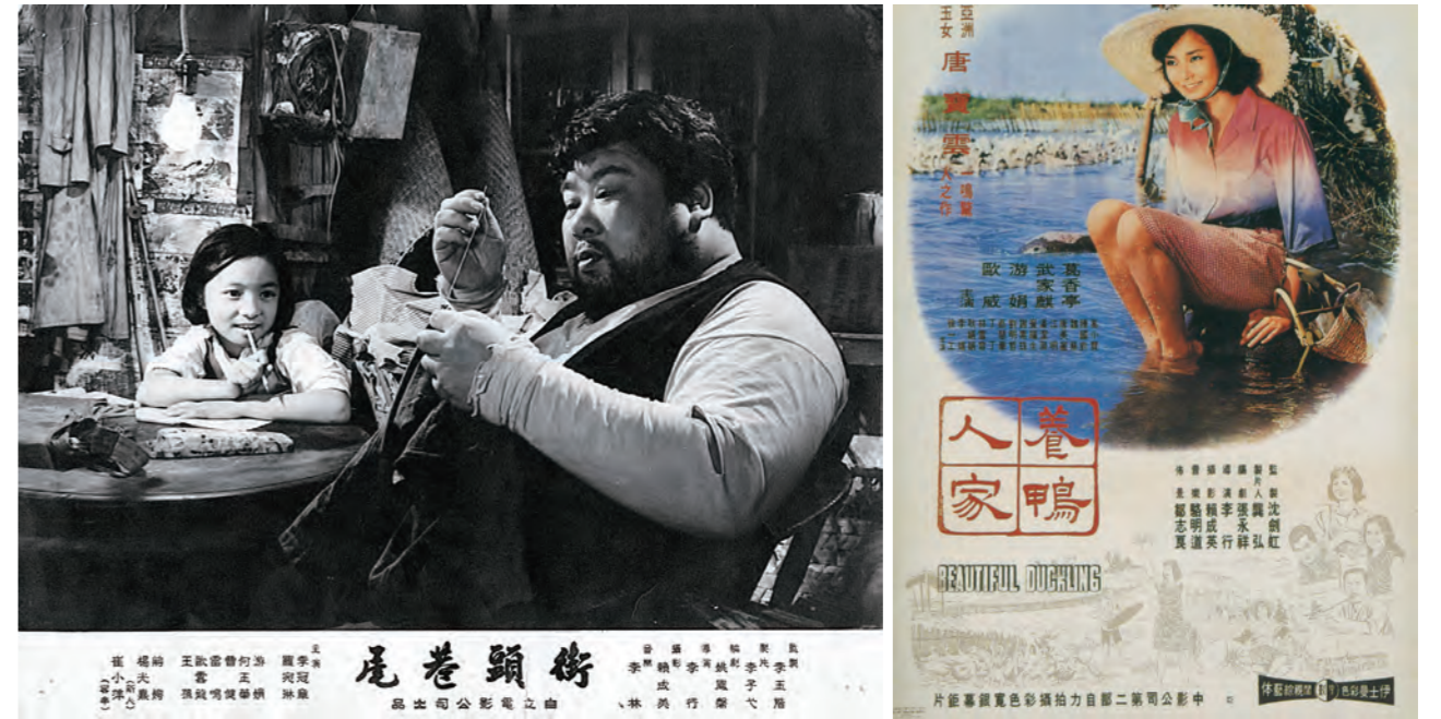
01. 李行與琉璃行字碑 02. 《街頭巷尾》自立電影公司發行 03. 《養鴨人家》中央電影公司發行