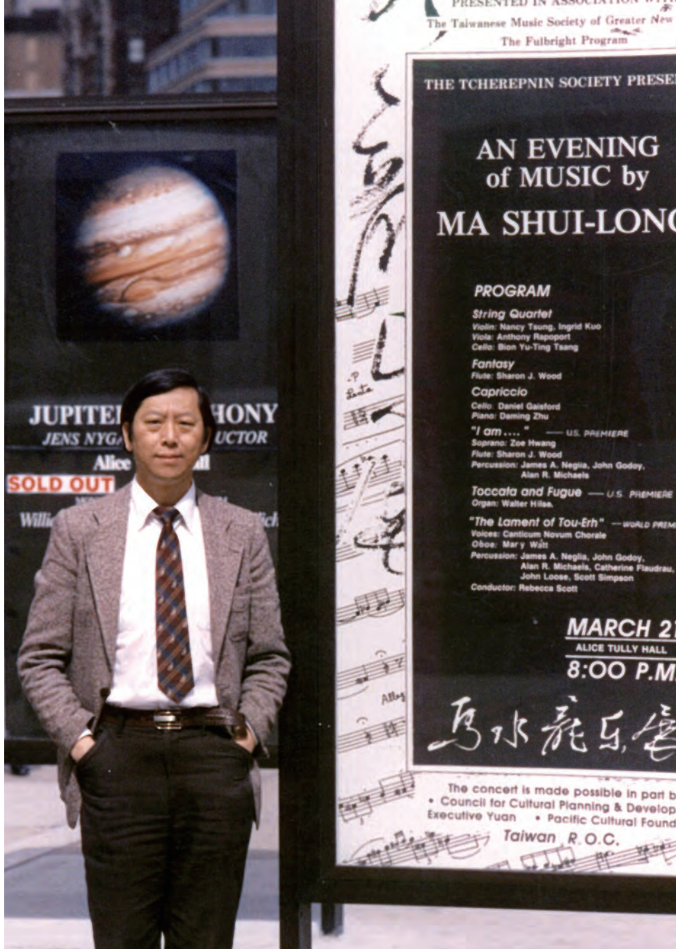
馬水龍於1986年紐約林肯中心舉行『馬水龍樂展』

與合唱曲等百餘首，皆曾發表於國內、歐美、俄國、南非及東南亞等二十餘國家；其作品《椰笛協奏曲》於1983年由羅斯托波維奇指揮美國國家交響樂團於臺北國父紀念館演出，並以衛星實況轉播至美國PBS公共電視網，深獲中外人士好評。1986年獲美國國務院傅爾布萊特學術獎助赴美進行研究，並於紐約林肯中心等地區前後以「馬水龍樂展」為名舉行十二場個人作品發表會，亦得到紐約時報及其他地區極高的評價。他是第一位於美國紐約林肯中心作整場個人作品發表會的臺灣作曲家。1991年被列入「世界名人錄」及「五百名人錄」，1993年《椰笛協奏曲》獲選為「二十世紀華人音樂經典作品」。1994年獲文建會獎助至美國進行學術研究，並於北伊大、耶魯、哈佛等大學做專題演講。2000年榮獲總統府特授予二等景星勳章，2007年獲頒國立台南大學名譽博士。