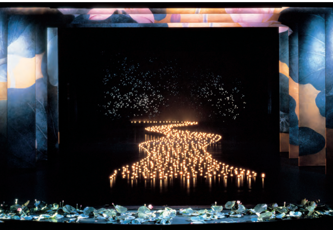
《九歌》 NINE SONGS, 1993