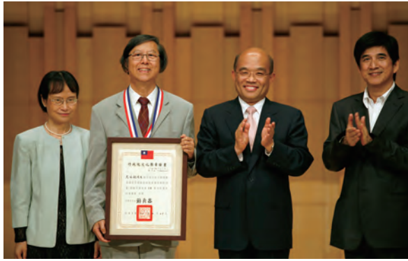
2007年獲頒行政院文化獎

馬水龍無論在創作或教學上，均堅持「先把握住自己的母語，再去學習別人的語言，否則將迷失在外，回不了家」的原則，他一方面在教學上加強傳統文化思想的發展；一方面仍不忘鞏固西樂的根柢，因此，在擔任