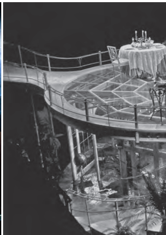
《唐璜》 DON JUAN, 1979

劇做過舞台設計，對此他表示：「與林懷民合作的經驗彷彿開啟了一扇門，使我重新找到了我的根——中國，儘管我的中國經驗其實很短暫，我的根可能吃土並不深。」