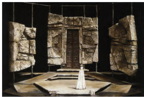
《伊蕾克特拉》 ELECTRA, 1964