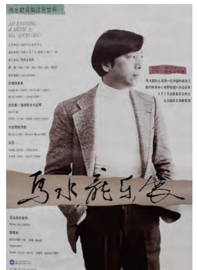
馬水龍於1990年在台北國際會議廳舉行『馬水龍樂展』演出海報

馬水龍擅長將視覺美學導入其音樂創作中，他喜歡強調「用耳朵聽見畫，以眼睛看見音樂」的概念，並且經常運用視覺藝術中的顏色、線條、型態……等作為音樂創作的元素，換言之，即是開放所有感官去欣賞並創作作品，這也使得他的音樂更為「有型」。